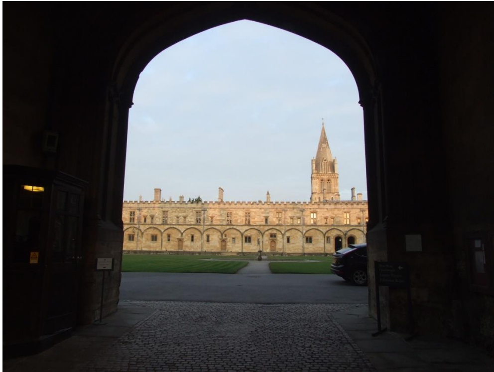
Slika 1. Christ Church College

arhitekturu i povijest Oxforda (Library of the Oxford Architectural and Historical Society), Odjel za papiruse i Arhivsko gradivo. Zbirka rijetkih knjiga i Arhivsko gradivo pohranjeni su u spremištima u podrumskome dijelu knjižnice, u prostorijama s odgovarajućom mikroklimom, u trajnim beskiselnim kutijama otpornima na plijesan i truljenje. Spremište je dislocirano.