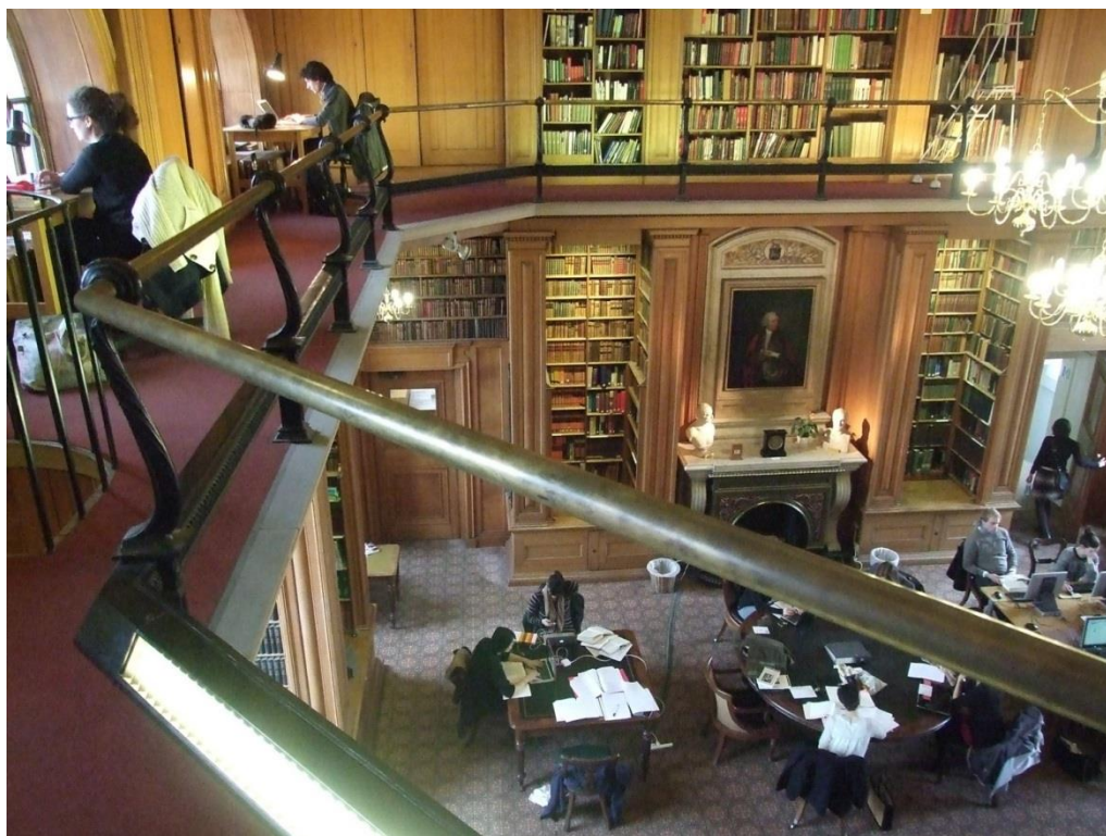
Slika 3. Knjižnica Taylor

To mi je povjerenje ukazano zbog mentorstva kolegice Vanese Conjar koja je podrijetlom iz Osijeka i tada je bila zaposlena u Sackleru. Ondje se tijekom radnoga vremena djelatnici izmjenjuju na jednostavnijim poslovima, uz redovne kratke pauze i jednu veću stanku za ručak. Opisat ću svoj tipični radni dan jer je bio kvalitetno i zanimljivo osmišljen, drugačiji nego što sam do tada igdje vidjela. Radno bi mi vrijeme započelo u 9.00 za glavnim informacijskim i posudbenim pultom. Ondje bih radila s još dvoje ili troje zaposlenika. Prvo što bismo napravili ujutro jest da bismo raspakirali kutije s knjigama koje bi pristigle iz dislociranoga spremišta te bismo knjige rasporedili na police uz informacijski pult. Paralelno bismo odgovarali na upite, zaduživali ili razduživali građu te vodili statistiku. Nakon sat i pol rada imali bismo stanku od 20 minuta u prostoru za odmor djelatnika na prvome katu Knjižnice. To je velika prostorija s kuhinjom, stolom za objedovanje te kaučem za odmor. Običaj je zaposlenika bio da bi svatko donio ponešto za objed i stavio na sredinu stola da bi se svi mogli poslužiti. Zaposlenici su se držali vremenskoga ograničenja jer se ulaz i izlaz iz prostorije bilježio karticom za prijavu, odnosno odjavu. Nakon toga moj je zadatak bio provesti sljedećih sat i pol vremena u Haverfield sobi gdje sam radila na uređivanju zbirke kataloga aukcija