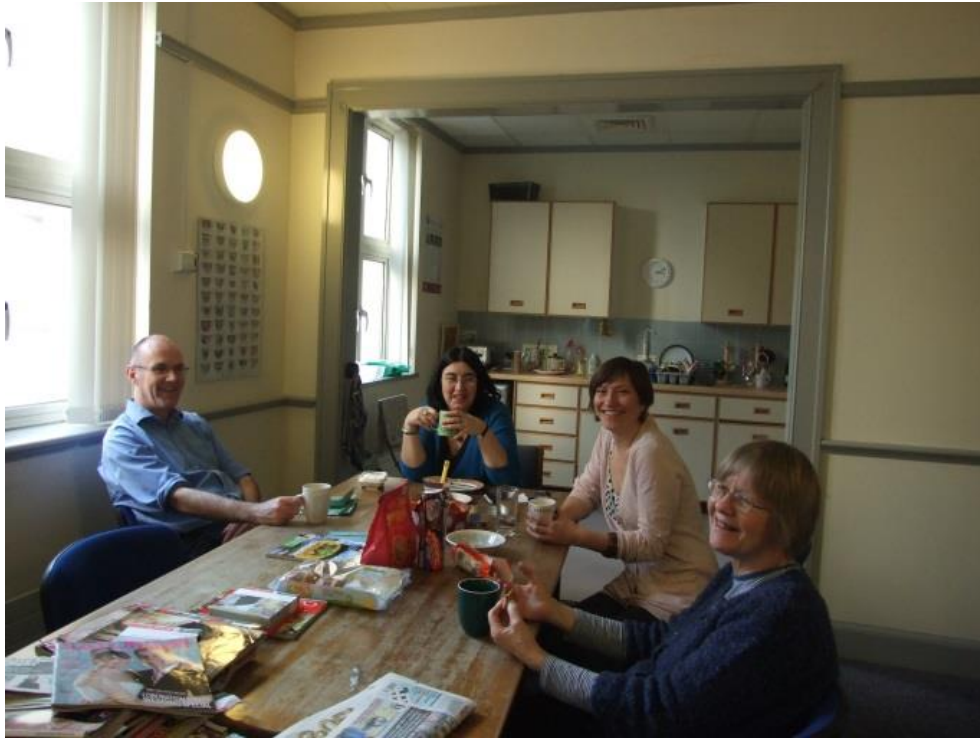
Slika 5. Prostorija za odmor djelatnika

stresa jer su zadaci i očekivanja bili jasno objašnjeni pri početku rada, voditelji odjela su pratili rad djelatnika i davali povratnu informaciju djelatnicima nakon završene svake etape zadatka.