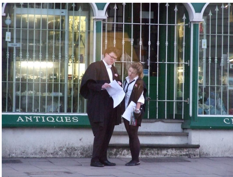
Slika 2. Studenti u Oxfordu za vrijeme ispitnih rokova

Korisnici imaju doticaj s knjižničarima za glavnim informacijskim i posudbenim pultom u blizini ulaza u knjižnicu te za informacijskim pultom na jednom od viših katova. S obzirom da je u našoj knjižnici na Filozofskome fakultetu običaj (premda je otvoreni pristup) da knjižničari donose knjige korisnicima na posudbeni pult, bilo mi je neobično naviknuti se da ondje fizički ne odlazim po knjige već eventualno upućujem korisnike gdje bi se knjige mogle nalaziti. Upiti nisu učestali, a knjižničari se za glavnim pultom uglavnom bave zaduživanjem i razduživanjem građe. U slučaju da studenti dolaze kod knjižničara po informaciju o smještaju knjige na polici, dolaze vrlo stidljivo, ispričavajući se jer je pretpostavka da usluge knjižnice koriste već obogaćeni znanjem s edukacija koje mogu pohađati na razini Sveučilišta (edukacije ne provode svaka knjižnica zasebno). Tako da se poznavanje rasporeda građe, signatura, pretraživanja mrežnoga kataloga i baza podataka očekuje od studenata, a smatra se da je zadaća knjižničara pružanje podrške i osiguravanje alata.