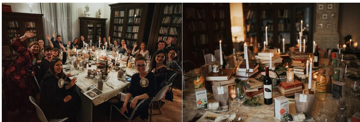
Slika 4. Sudionici Tajne večere

U prostorima Knjižnice dočekala ih je i pozdravila kolegica Špoljarić Kizivat koja im je ispričala ponešto o posebnosti same prostorije u kojoj će večerati. Od originalnog inventara dr. Vjekoslava Hengla, osječkoga odvjetnika i budućega gradonačelnika, do danas u Knjižnici su sačuvane kaljeve peći, 4 ormara u kojima se nalazila obiteljska knjižnica, stol i stolica. Ostaci nekadašnjega duha vremena u kojemu se razvijala knjižnica su u današnjoj sobi gdje je smještena Zavičajna zbirka, najvrjednija zbirka Knjižnice. Zbirka obuhvaća građu od značaja za Grad Osijek i Sveučilište Josipa Jurja Strossmayera u Osijeku (Mursianu), kao i Županiju osječko-baranjsku i Slavoniju (Slavonica).