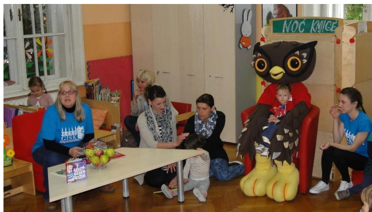
Slika 3. Noć knjige na Odjelu za rad s djecom i mladima

Ovogodišnja Noć knjige u Gradskoj i sveučilišnoj knjižnici Osijek imala je i jedan uistinu originalan dio programa. Knjige, književnost i prostor knjižnice tim popularnog projekta "Secret dinner by Filipa Sorko" je više nego inspirirao te su već i pozivnice mogle naslutiti koja je točno tema ove "Tajne večere". Zidovi prostorije koju je Filipi i njenom timu knjižnica ustupila na korištenje bili su prekriveni velikim, starinskim, drvenim ormarima prepunim knjigama, te su poslužiti kao savršena kulisa magičnoj književnoj "Tajnoj večeri" koja se spremala. Kada se kreativni tim unio u temu, jela na jelovniku dobila su imena poznatih književnih djela i pisaca.