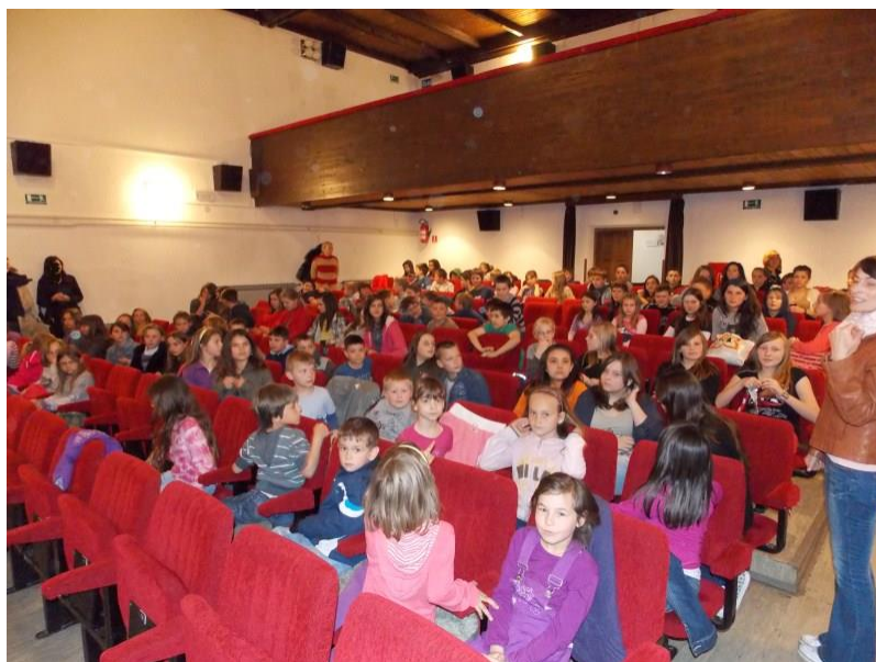
Slika 1. Dani slovačkog filma 2013. godine

pa predstavljanje slovačke kinematografije u Našicama nema u svojoj osnovi samo umjetničku dimenziju, već i širu društvenu, povijesnu i edukativnu svrhu. Naime, primarni dio gledatelja predstavljaju pripadnici slovačke manjine u Hrvatskoj, koji kroz ovaj medij mogu bolje sagledati život i društvene promjene zemlje i naroda čiji su integralni dio jednom davno i sami bili.