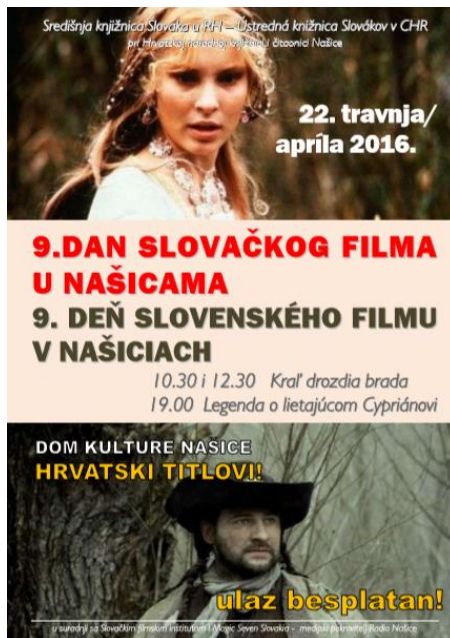
Slika 4. Plakat za Dan slovačkog filma 2016. godine