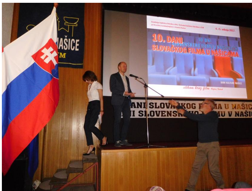
Slika 2. Jubilarni Dani slovačkog filma 2017. godine

spektakli) koji osiguravaju raznovrsnost i obuhvaćaju najznačajnija djela slovačke kinematografije. Slovački film u Našicama godišnje u prosjeku vidi oko 250 posjetitelja, što do danas daje respektabilnu brojku od 2500 gledatelja koji su se pobliže upoznali sa slovačkom kinematografijom. Uz građane grada Našica to su mahom Slovaci iz Jelisavca, Markovca, Josipovca, ali i Osijeka